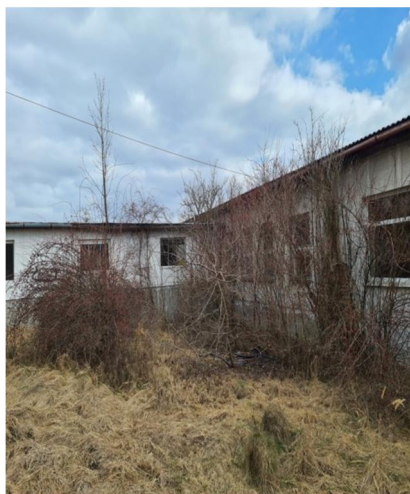
inv.č.51 Rosa sp., Sambucus nigra Malus sp., Swida sanguinea