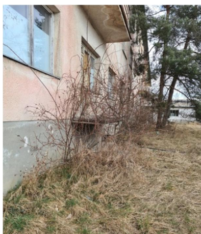
inv.č.39 Rosa sp. , Acer campestre , Prunus spinosa