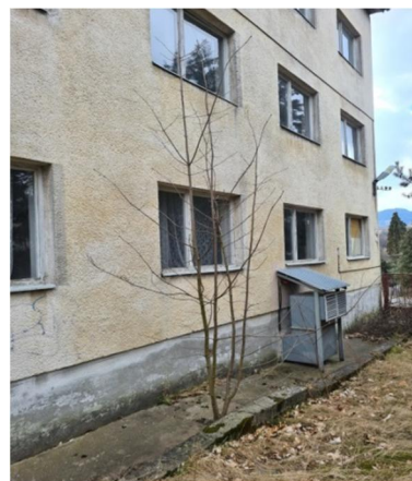
inv.č.25-26 Acer pseudoplatanus