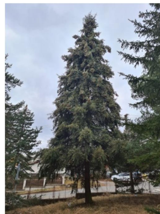
inv.č. 15- Picea menziesii