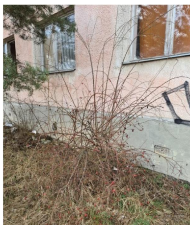
inv.č.40 Rosa sp.