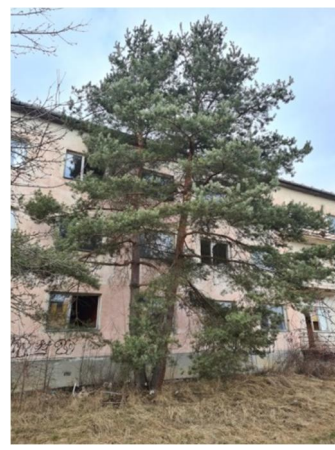
inv.č. 18-19 Pinus sylvestris