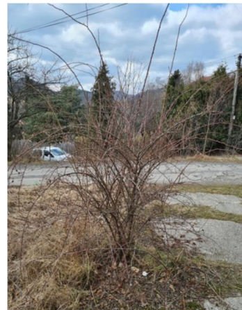
inv.č.45 Rosa sp.