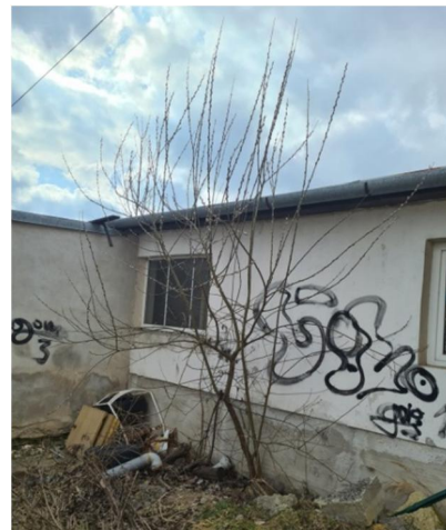
inv.č.50 Salix caprea