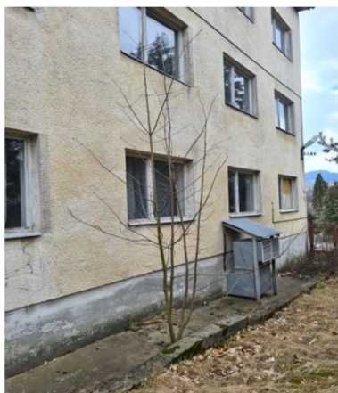
inv.č.24 Acer pseudoplatanus