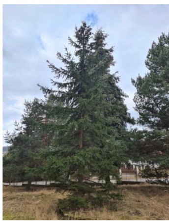
inv.č. 17 Picea abies