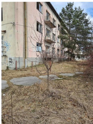
inv.č. 27 Malus sp.