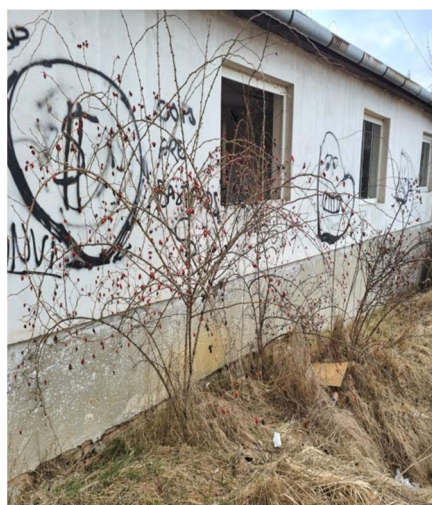
inv.č.51 Rosa sp.,