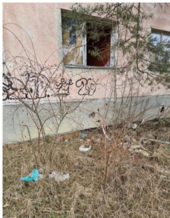
inv.č.42 Rosa sp