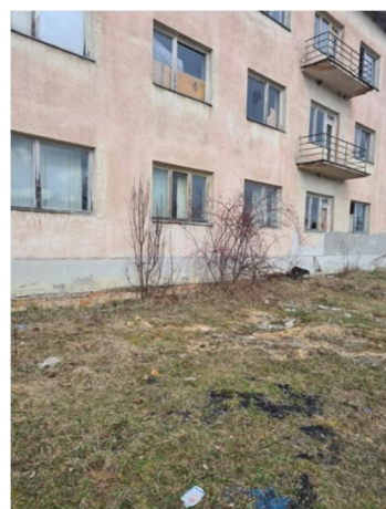
inv.č.41 Rosa sp.