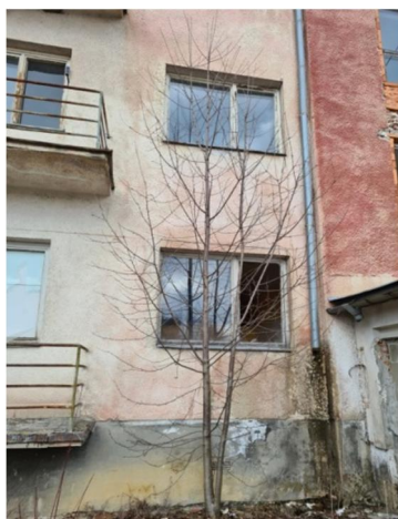
inv.č. 32 Cerasus avium