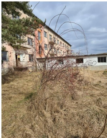
inv.č.43 Rosa sp.