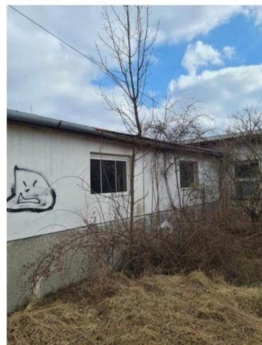
inv.č. 31 Fraxinus excelsior