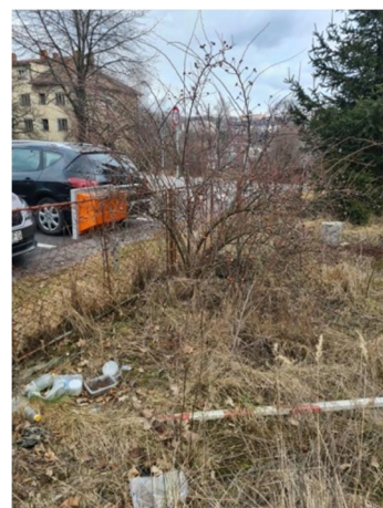
inv.č.36 Rosa sp.