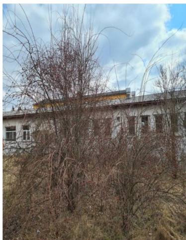
inv.č.45 Rosa sp.