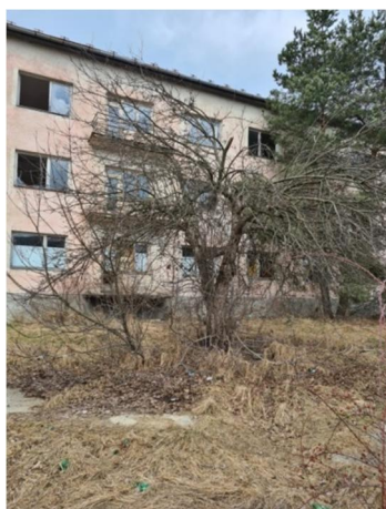
inv.č.33-34 Malus sp.