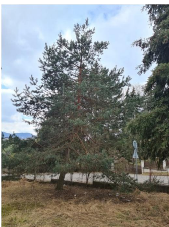
inv.č. 16 Pinus sylvestris