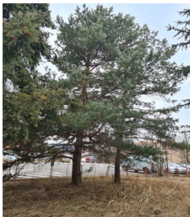
inv.č. 13,14 Picea Pinus sylvestris