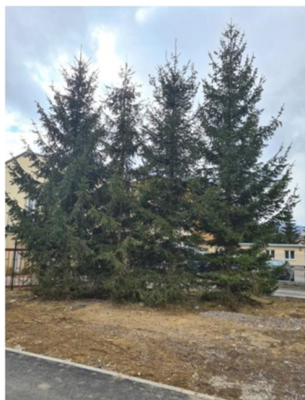
inv.č. 1-4 Picea abies