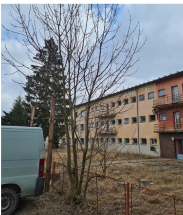
inv.č. 23 Fraxinus excelsior – trs