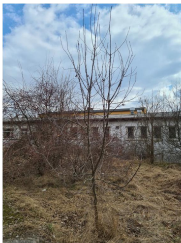
inv.č. 27 Malus sp.