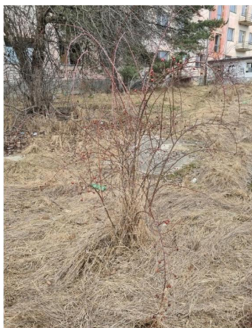
inv.č.49 Rosa sp.,